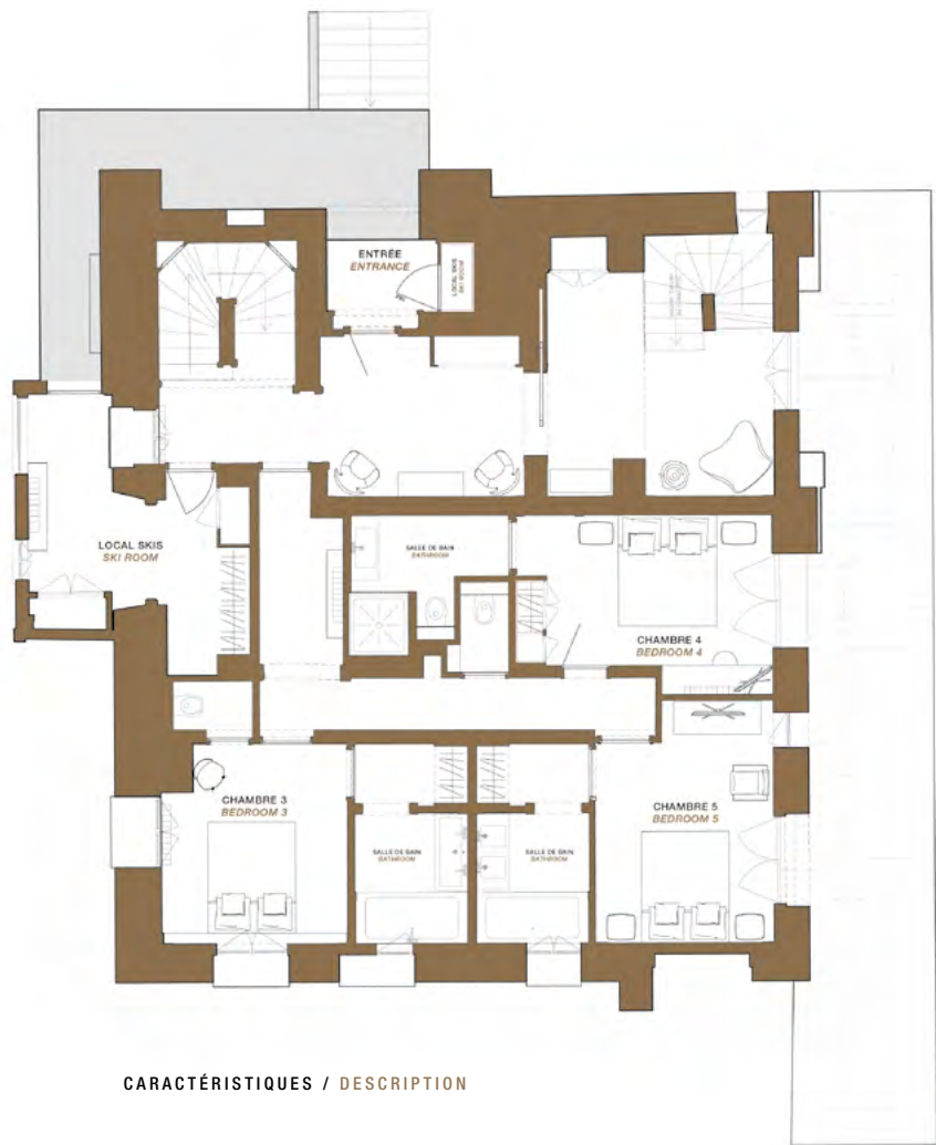
Rez-de-chaussée Ground floor